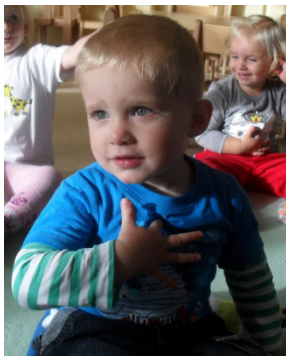
Das Ich entdecken